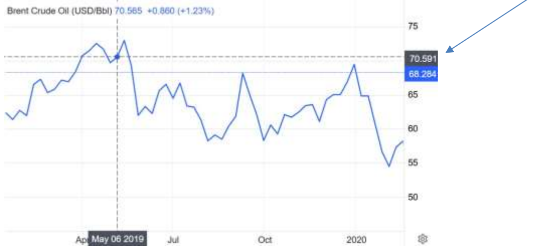
Figura 01 Petróleo Brent em maio de 2019 (R$ 70,59)