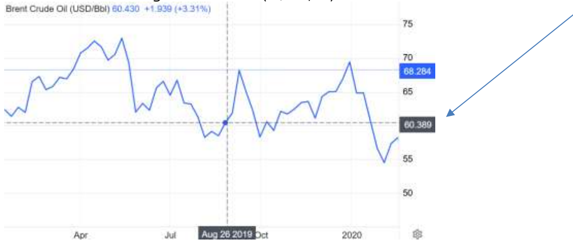
Figura 02 Petróleo Brent em agosto de 2019 (R$ 60,39)