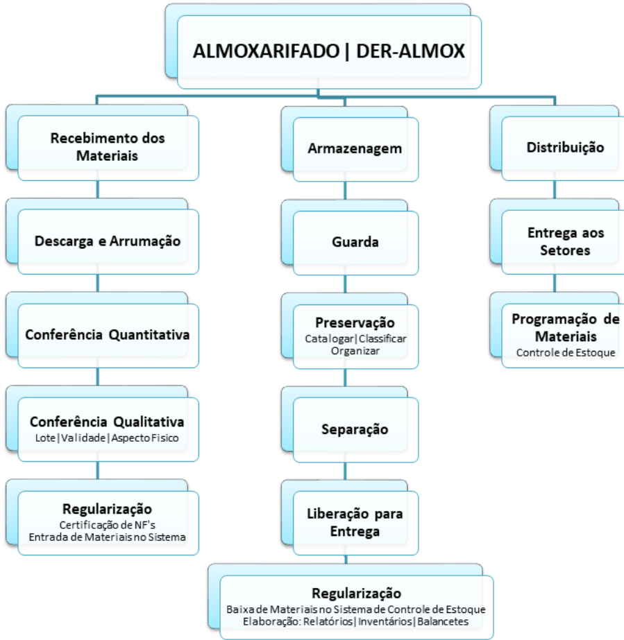
Figura 1: Fluxograma de trabalho do Almoarifado | DER-ALMOX -Autor: Gleysson Francisco Shreder da Silva - Almoarifado | DER-RO

para a nova instalação ainda neste ano de 2021. Condições do espaço físico: PRECÁRIO | INSUFICIENTE | INADEQUADO. Da localização Av. Rio Madeira, Nº 3056, Bairro: Flodoaldo Pontes Pinto. Porto Velho (RO). CEP: 76820-408. Ponto de referência: Ao lado do PORTO VELHO SHOPPING. ESTRUTURA DE GERENCIAMENTO DO ALMOXARIFADO - FLUXOGRAMA